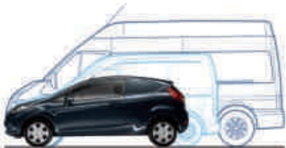
Model: Fiesta Van Trend